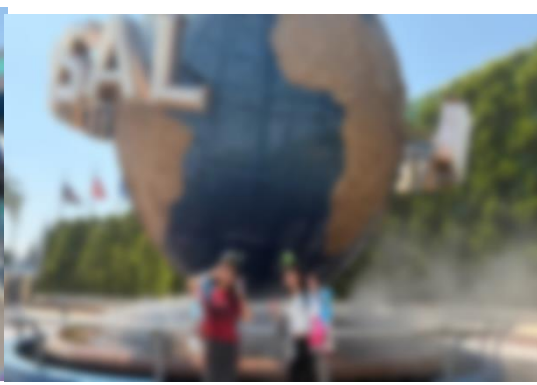
USJ (ユニバーサルスタジオジャパン)