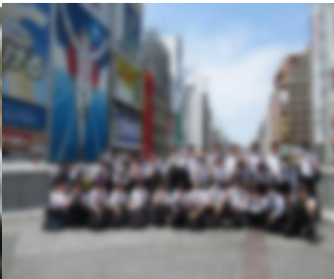
道頓堀橋(グリコ前)